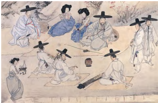
◀ 신윤복, 「상춘야흥」 전문 예인들이 참석한 연회에서 가곡창을 하는 모습을 담고 있어 조선 후기의 시조 향유 방식을 짐작할 수 있다.